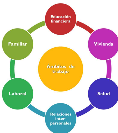
Fig.4: Ámbitos de preparación para Autonomía

El Diagnóstico consiste en identificar de cada joven las fortalezas y debilidades en los aspectos mencionados y en base a ello, definir los aspectos que requieren mayor apoyo para su desarrollo de autonomía.