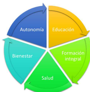
Fig. 3 TK II: Áreas de Acompañamiento Integral

3.2 Casa de Acompañamiento Integral TK II.- El Equipo de trabajo conformado por Educadoras, Psicólogas, Trabajadoras Sociales, Gestoras Sociales, Abogado, Instructoras de Economía Básica e Instructor de Reforzamiento Educativo, establecen e implementan los PAINA Proyectos de atención integral PAINA de acuerdo (conforme requerimiento del MIES Ministerio de Inclusión Económica y Social) y a las características únicas de cada Niña y Adolescente desarrollados en los programas siguientes: