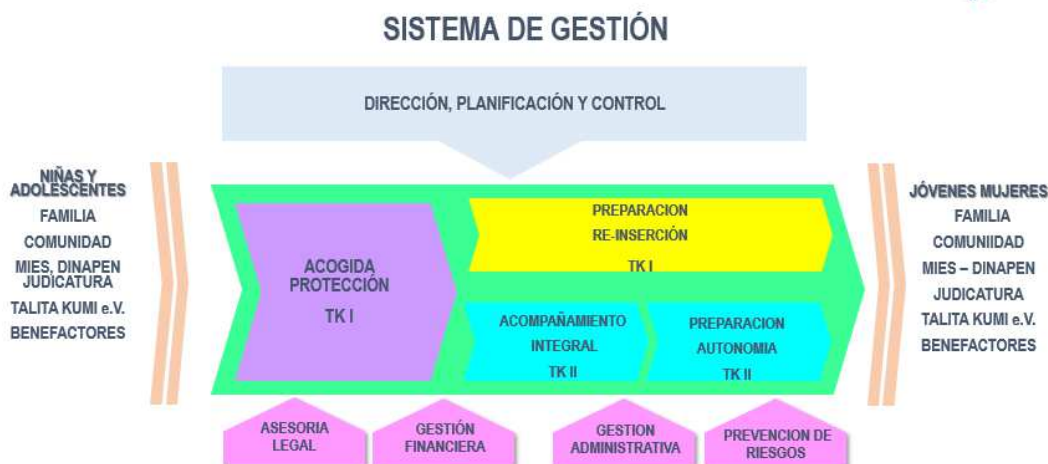
Fig.1: Mapa de Procesos

Los procesos son desarrollados por con un Equipo Interdisciplinario de Trabajo conformado por profesionales competentes, quienes realizan las actividades de Acogimiento y Protección de las Niñas y Adolescentes en TK I y el Acompañamiento Integral en TK II, manteniendo comunicación continua con los grupos de interés, en asuntos regulatorios con la Judicatura, la normativa aplicable con el MIES Ministerio de Inclusión Social y Económica, las familias de las Niñas y Adolescentes por el Bienestar de la Niñas y Adolescentes, así como con los Benefactores y la Contraparte Talita Kumi e.V.